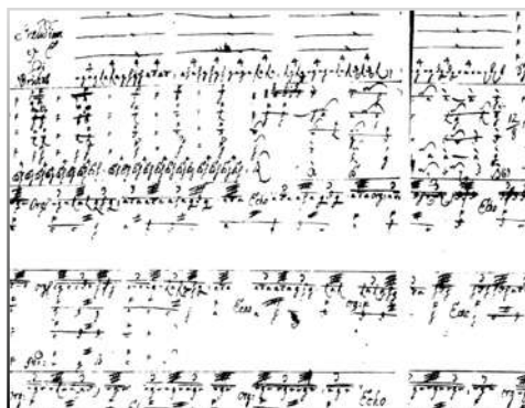
Manuskrypt tabulatury organowej – Wielkie Preludium e-moll

Twórczość Nicolausa Bruhnsa dzieli się na trzy zasadnicze filary: organową, wokально-instrumentalną i kameralną. Z tej ostatniej niestety nie zachowały się żadne utwory. Jest to strata tym większa, że kompozytor był wirtuozem gry na skrzypcach i violi da gamba, a ponadto często grywał jednocześnie na skrzypcach i organach, o czym pisze Mattheson: „Czasami zabierał swoje skrzypce na chór organowy i grał na nich z taką zręcznością, iż można było odnieść wrażenie, że to