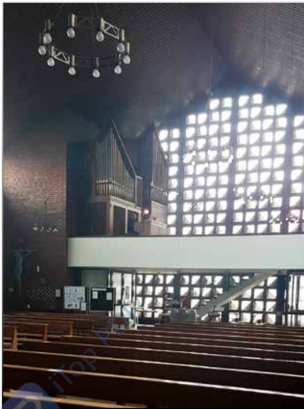
Prospekt organów w Duisburgu

Wskutek zmniejszającej się liczby wiernych, a także błędów konstrukcyjnych w budowie kościoła, zdecy-