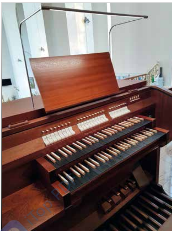
Kontuar organów w kościele Matki Bożej Szkaplerznej w Tarnowie

Poświęcenie organów planowane jest na 22 listopada 2022 roku (liturgiczne wspomnienie świętej Cecylii, patronki muzyki kościelnej). W momencie oddania do druku artykułu przy instrumencie trwają intensywne prace stolarskie. Wobec tego zamieszczono zdjęcie niekompletnego prospektu, bez figur świętych oraz wszystkich detali snycerskich. Należy cieszyć się, że diecezja tarnowska i samo miasto Tarnów wzbogaciły się o kolejne wartościowe organy, które – jak mam nadzieję jako jeden z głównych uczestników tego wielkiego przedsięwzięcia – będą służyć długo i niezawodnie parafii w sprawowaniu kultu, a także całemu miastu w celach koncertowych. Na koniec niniejszego artykułu pragnę złożyć serdeczne podziękowania wszystkim zaangażowanym w pozyskanie organów dla parafii Matki Bożej Szkaplerznej w Tarnowie. To piękne dzieło jest owocem współpracy wielu specjalistów. Należy docenić także wyrozumiałość, ofiarność i zaangażowanie samych parafian, dzięki czemu będą mogli się oni cieszyć instrumentem wysokiej jakości.