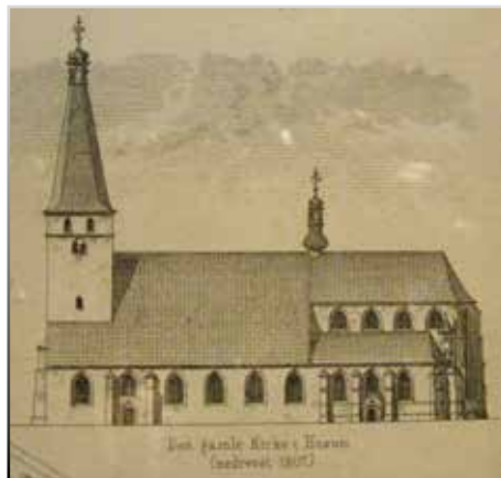
Zdjęcie starego kościoła w Husum