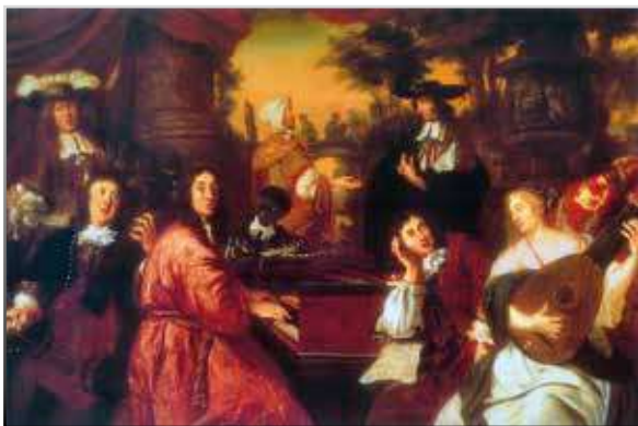
Johannes Voorhout – „Domowa scena muzyczna”, Muzeum Historii Hamburga, 1674.

Warto w tym miejscu poświęcić kilka słów instrumentarium omawianego kościoła. Do tej pory (stan badań na 2021 rok) niewiele wiadomo o organach, na których grał Nicolaus Bruhns, jak i o ogólnej historii organów w kościele mariackim (Marienkirche) przed zastąpieniem gotyckiej budowli nową, w stylu klasycystycznym. Zachowała się wzmianka, że Bruhns miał do dyspozycji organy odrestaurowane przez Gottfrieda Fritscha w 1629 roku.