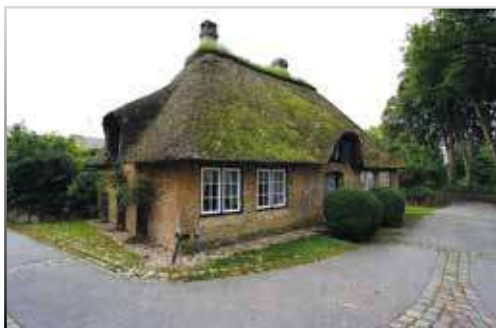
Dom Nicolausa Bruhnsa w Schwabstedt.

Młody Nicolaus uczył się u wujaka gry na skrzypcach i violi da gamba,