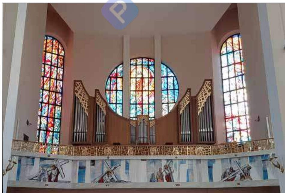
Prospekt organów po przeniesieniu do Tarnowa

znad Schwellwerku na prawą stronę szafy i obrócony o 90 stopni celem redukcji szerokości całego instrumentu. Wymagało to zaprojektowania i wykonania nowej traktury gry manuału I. Nowy układ wnętrza wymusił zmiany także w budowie traktury prospektu. Pierwotny prospekt podzielony był na dwie wieże. W jednej znajdowały się piszczałki manuałowego Pryncypału 8', w drugiej zaś piszczałki pedałowego Oktawbasu 8', wszystkie zasilane bezpośrednio z wiatrownic. W nowym prospekcie piszczałki Oktawbasu znalazły się w skrajnych wieżach, zaś Pryncypału w środkowych. Wobec większej niż pierwotnie odległości od wiatrownic większa część prospektu zasilana jest za pomocą nowo wykonanych wiatrowniczek stożkowych. System powietrzny organów składa