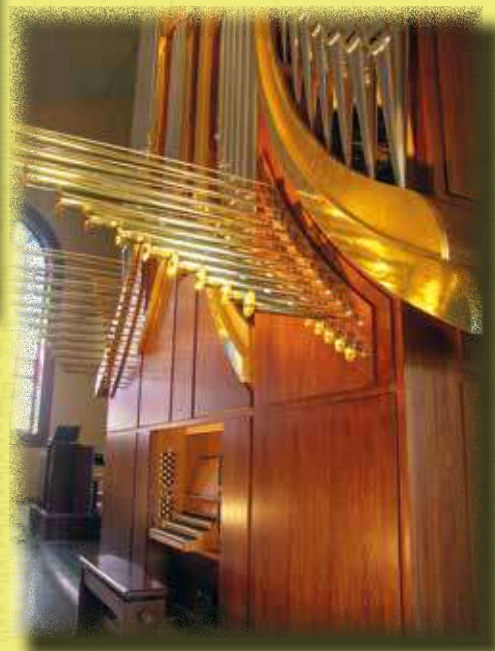
Nowe organy w kościele Matki Bożej Niepokalanej w Nowym Sączu wraz z trąbką hiszpańską w prospekcie.