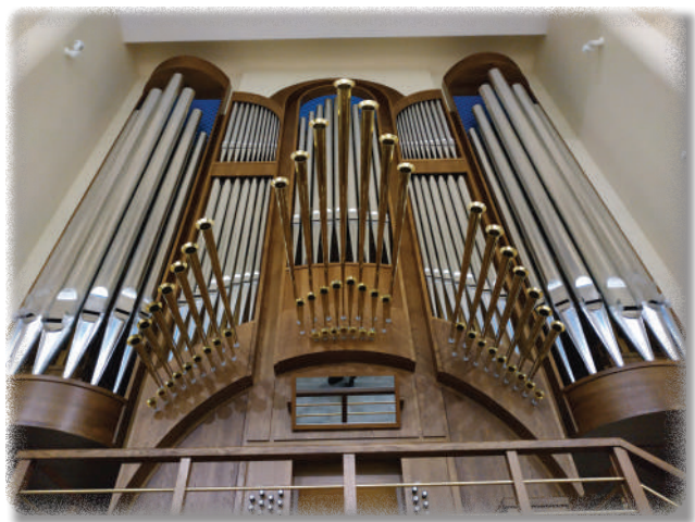
Prospekt organów firmy Zych w nowym kościele w Słopnicach.

Poświęcenia nowo zbudowanej świątyni pod wezwaniem św. Jana Pawła II dokonał 16 listopada 2013 r. bp Andrzej Jeż. Konsekracja kościoła planowana była na 2020 rok, ale została przełożona z powodu pandemii COVID-19. Obecnie planuje się ją na 2024 rok. Co niezczęste i godne pochwały, już w kilka lat po zakończeniu prac budowlanych w kościele zaczęto planować budowę organów. W sprawie mającego powstać instrumentu prowadzono w 2019 r.