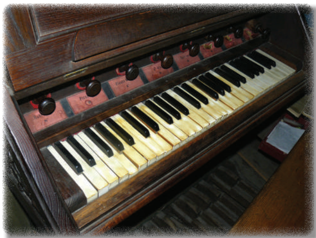
Kontuar organów T. Falla w kościele drewnianym w Słopnicach.