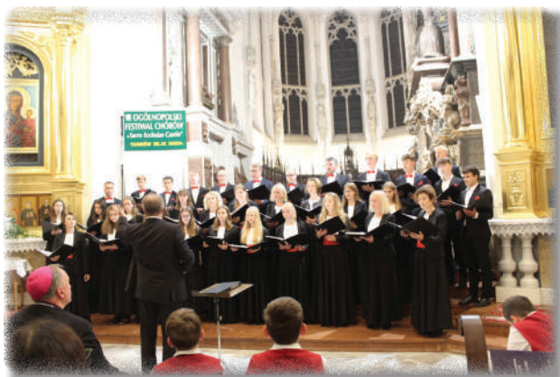
Chór Mieszany SCHOLA CANTORUM MAXIMILIANUM z Józefowa – laureat I nagrody