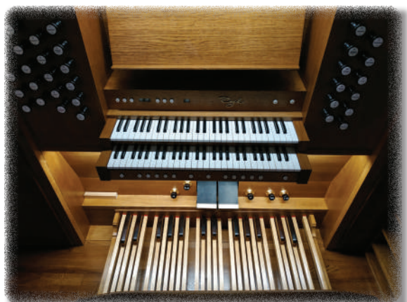
Stół gry organów firmy Zych w nowym kościele w Słopnicach.