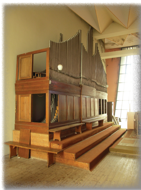
Organy po przeniesieniu do dobudowanej części świątyni