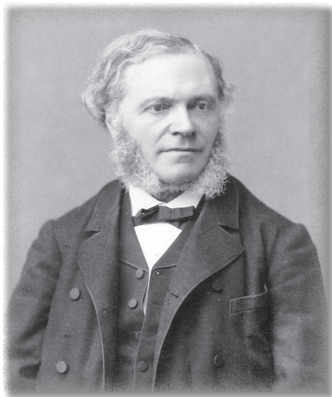
César Franck

Dzieje Liège, w którym przyszedł na świat César Franck, były na przestrzeni wieków burzliwe. Początek miasta, położonego nad rzeką Mozą, datuje się około roku 558. Związane jest z osobą św. Lamberta, biskupa, który ok. roku 700 nawracał w tym regionie pogan, jednak niedługo później, około 705 roku, poniósł śmierć męczeńską. W miejscu kaźni wybudowano bazylikę, do której przeniesiono jego ciało, złożone uprzednio w Maastricht. Stąd kult zamordowanego biskupa rozszerzył się na całą Francję i kraje ościenne. Z czasem Liège stało się stolicą biskupstwa. Po upływie kilkuset lat, w 1789 roku, podczas Wielkiej Rewolucji Francuskiej miejscowa ludność zbuntowała się przeciw władzy biskupa i zadecydowała o wyburzeniu świątyni. Miasto przejęła wówczas francuska armia, wprowadzono antyklerykalny reżim, a katedra św. Lamberta została do 1827 roku całkowicie rozebrana. Sytuacja katolików poprawiła się dopiero po 1801 roku, po podpisaniu konkordatu. Francja straciła miasto w roku 1815 podczas kongresu wiedeńskiego. Zostało ono wówczas przyznane nowopowstałemu Królestwu Zjednoczonych Niderlan-