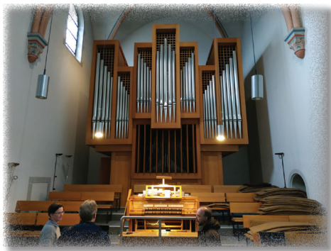
Organy w kościele w Oberhausen przed translokacją