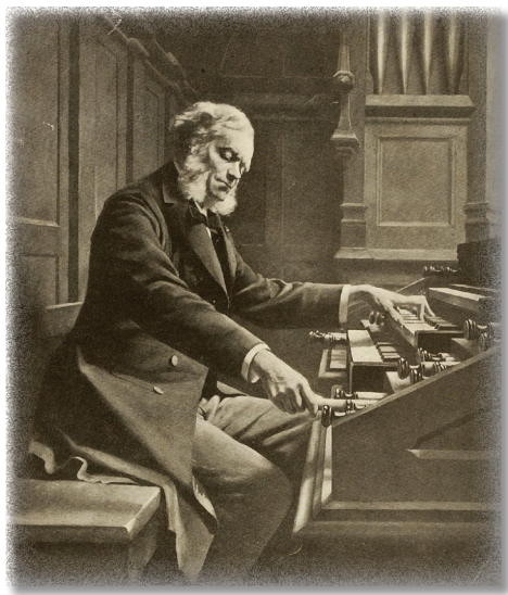
César Franck przy kontuarze organów Ste-Clotilde w Paryżu.

Praca na stanowisku organisty ujawniła wybitny talent Francka w zakresie improwizacji organowej, której w 1866 roku wysłuchał Liszt. Porównał wówczas jej sztukę i maestrię do sztuki Jana Sebastiana Bacha. Francuski artysta zyskiwał na popularności, zapraszano go na uroczystości inauguracji nowych organów w Belgii i we Francji. Był to jednocześnie czas stagnacji w zakresie kompozycji. Jeśli pisał, to głównie utwory religijne na chór i organy, co było związane z działalnością zawodową. Tę tendencję zaczął przewyżczać po inauguracji nowych monumentalnych organów w kościele Ste-Clotilde w Paryżu. Wydarzenie miało miejsce 18 grudnia 1859 roku. Instrument zbudował wybitny francuski organmistrz, Aristide Cavaillé-Coll. Franck przewyciężył jednak kryzys w pełni dopiero z chwilą rozpoczęcia prac nad ośmio-częściowym oratorium Les béatitudes w 1869 roku. Trzeci okres działalności Francka związany jest z kolejnymi wydarzeniami z historii Francji i Paryża. Wojna prusko-francuska i proklamowanie w marcu 1871 roku Komuny Paryskiej wpłynęły twórczo na niego. Wydarzenia te upamiętnił kantatami Paris i Patria , co świadczy o jego patriotycznym zaangażowaniu o kraj. Ówczesne życie muzyczne zdominowane było przez operę. Po