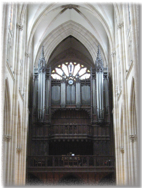
Prospekt organów A. Cavallé-Colla w kościele Ste-Clotilde w Paryżu.

Couperina (1688-1733) czy Louisa-Nicolasa Clérambaulta (1676-1749) pozostały niewykorzystane. Sytuacja ta niebawem miała się jednak zmienić.