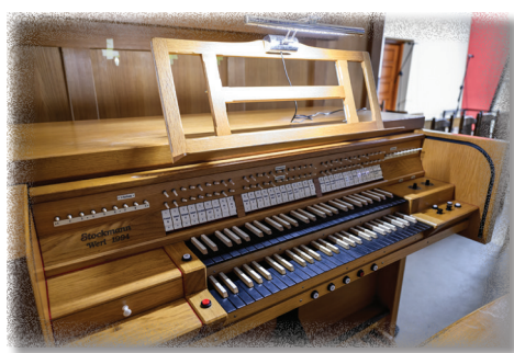
Kontuar organów firmy Stockmann w kościele św. Jakuba w Brzesku

Warto podkreślić wysoką jakość wykonania omawianych organów. Do ich budowy użyto materiałów wysokiej klasy, uwagę zwraca też precyzja wykonania. Po dwóch rozbiórkach i trzech montażach instrument wygląda nadal jak nowy. Szafa organowa wykonana jest z płyt stolarskich pokrytych dębowym fornirem. Konstrukcja składa się z solidnego mahoniowego stelaża spiętego jesionowymi belkami ciągnącymi się przez całą szerokość instrumentu w czterech miejscach. Traktura gry jest w pełni mechaniczna, samonapinająca, składa się z cedrowych abstraktów, jaworowych kątowników oraz metalowych wałków skrętnych. Większość piszczałek metalowych wykonana jest z wysokiego stopu cyny. Organy posiadają jeden wentylator Ventus firmy Laukhuff, obok którego znajduje się miech pływakowy, z którego powietrze rozprowadzane jest drewnianymi kanałami do wiatrownic. Każda z nich ma wbudowany w dno własny miech, którego ciśnienie regulują sprężyny. Traktura gry elektryczna o napięciu 12 V, oparta na elektromagnesach firmy Laukhuff. Sekcja brzmieniowa manuału II znajduje się w szafie ekspresyjnej, na dolnym piętrze. Nad nim, na środku, usytuowana jest sekcja manuału I, a po bokach sekcja pedału podzielona na strony C i Cis. Dyspozycja przedstawia się następująco: